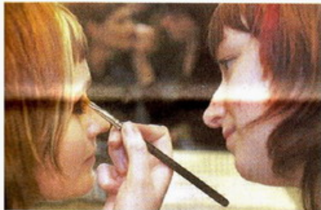
h das Make-up wird beim Wettbewerb bewertet.

Wie sehr sie auf das Können ihrer Kolleginnen vertraut, bewies sie dann auch beim Düsseldorfer Regionalfinale. Da hatte sie sich mutig ihren ehemaligen Auszubildenden als Modell zur Verfügung gestellt und wurde selbst auf den Laufsteg geschickt. Mit Erfolg, sie reist im Oktober mit den drei anderen Teams zum Grande Finale der Schmitz, pardon, „L'oreal Colour Trophy“.